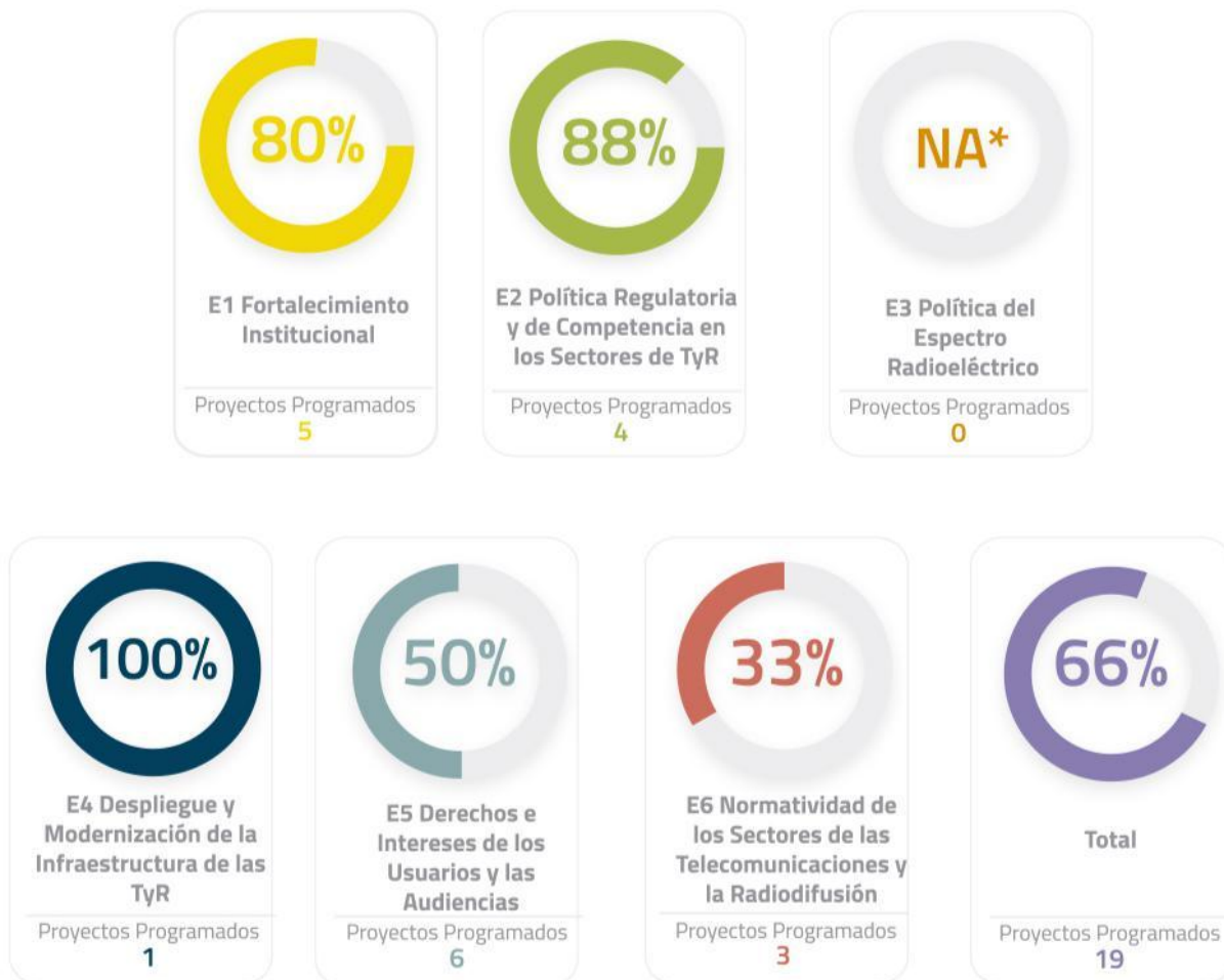
Figura 2. Avance de Proyectos de 2016, alineados a Estrategias (Trimestre 2016)

Durante el periodo reportado se logró un avance del 66% respecto a lo programado. El motivo principal por el cual no se alcanzó el 34% restante se debe al cambio de alcance en los proyectos a desarrollar durante el trimestre.